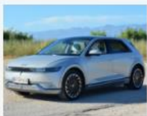
2 x 650 Kilometer im fremden Elektroauto.