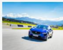
Jaguar erhöht sein Garantieverprechen von 3 auf 5 Jahre