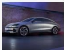
Hyundai IONIQ 6: „Electrified Streamliner“