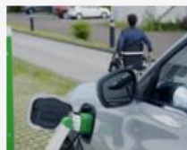
Ford testet eine Roboter-Ladesäule für Menschen mit körperlichen Einschränkungen