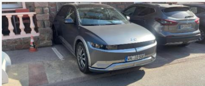
Christian Bumke auf eTOUR auf Korsika