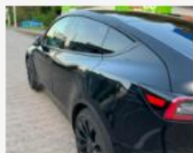
Dominik Bach unterwegs auf eTOUR in Italien