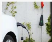
Regionaler Wertschöpfungsansatz mit klarer gelebter Philosophie.