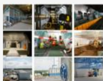
Ford veröffentlicht Plan zur Sicherung von Batterie-Kapazitäten