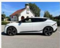
Kompromisslos agil und bereit für eine eTOUR: unterwegs mit dem KIA EV6 AWD GT Line