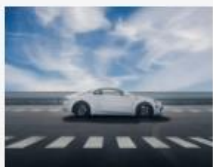
A110 E-TERNITE: 100% elektrischer Prototyp von Alpine